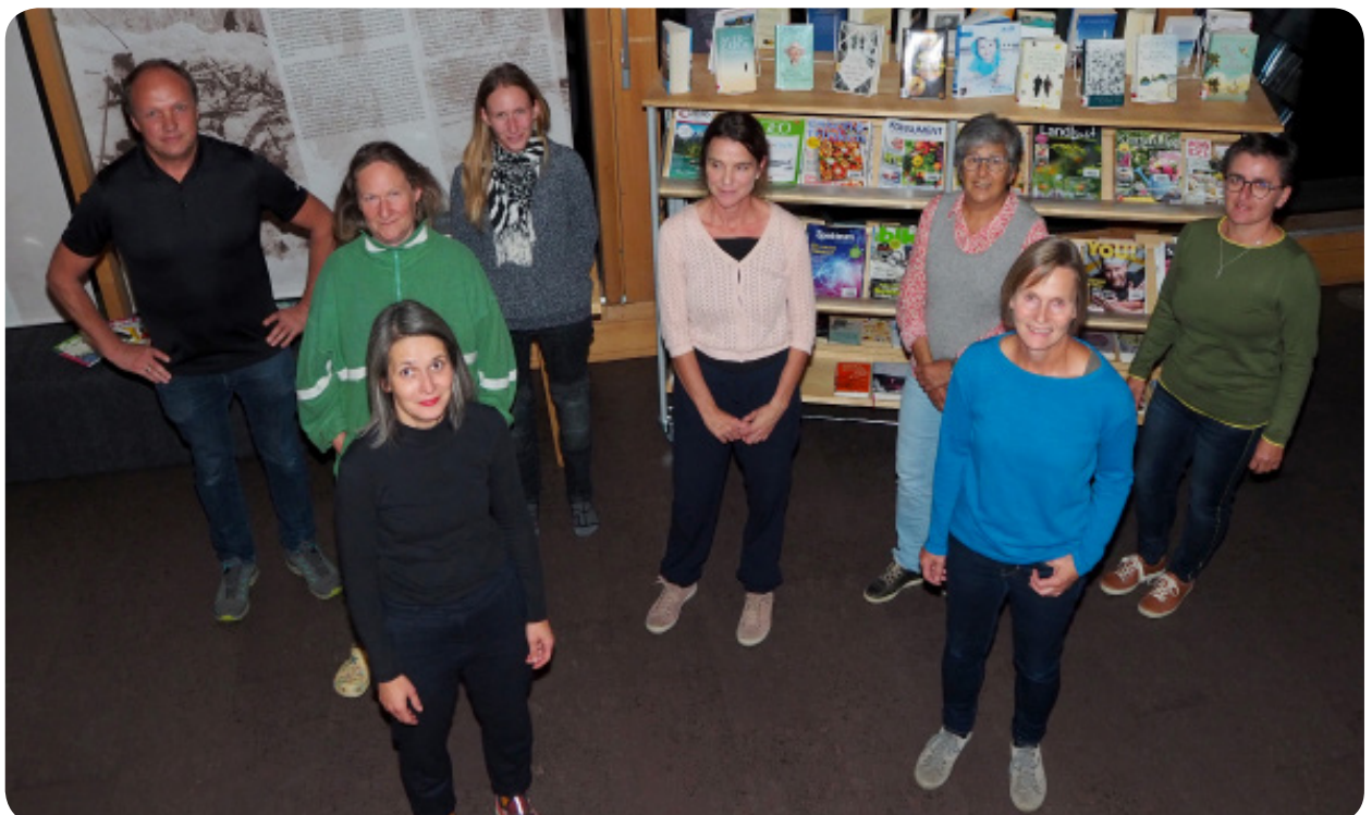
Lucia Studer fehlt auf dem Bild

An dieser Stelle sei dem gesamten Team wie immer ein herzliches Danke für das ehrenamtliche Engagement gesagt.